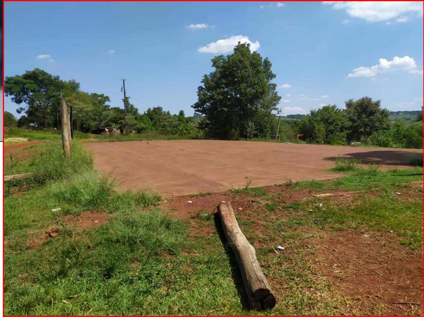
<< SITUAÇÃO ATUAL DO LOCAL