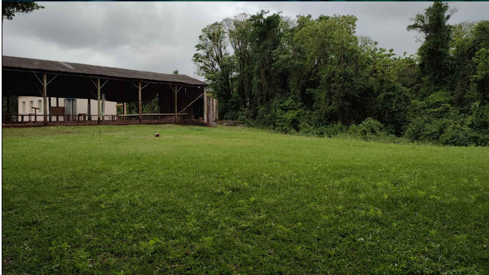
<< SITUAÇÃO ATUAL DO LOCAL