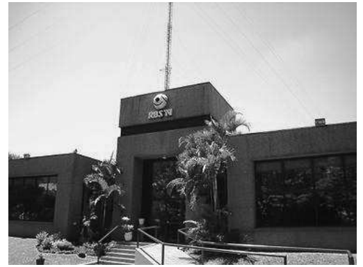
Sede da RBS TV Santa Rosa