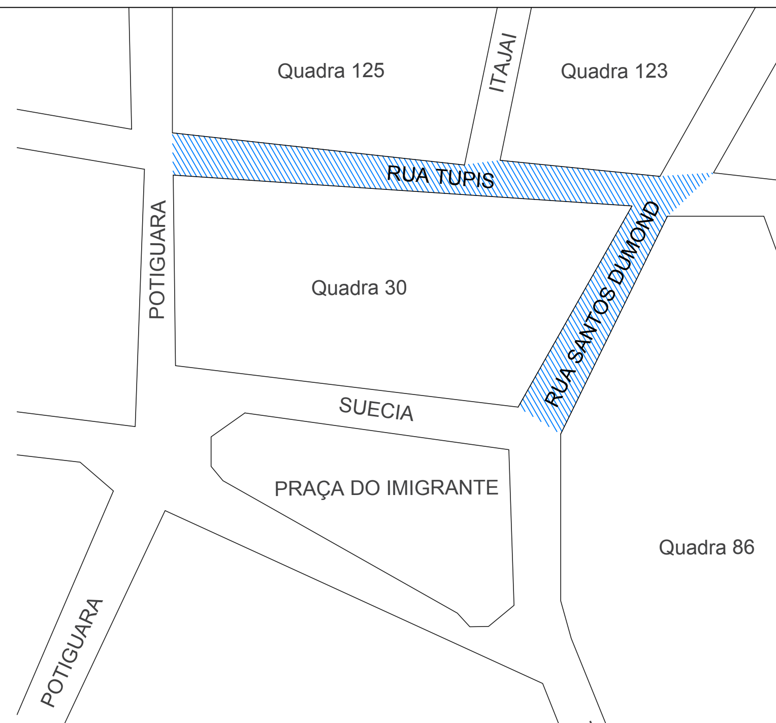
PLANTA BAIXA DE SITUAÇÃO Esc.: S/E