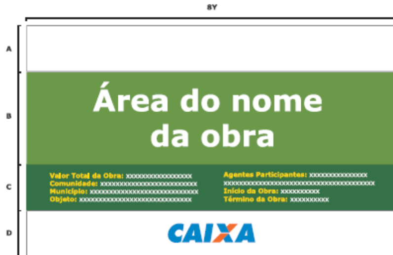
Figura 01: Modelo de Placa de Obra

1.2 - Locação da obra: deverá ser feita a locação da obra dentro do terreno, sendo a mesma executada rigorosamente conforme projetos, tendo os gabaritos fabricados em madeira. Os mesmos deverão estar bem afixados ao solo e distante 2 metros da borda da edificação a ser construída.